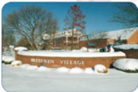
Brethren Village, Lancaster (EEUU)